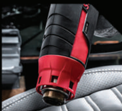
PISTOLA DE CALOR